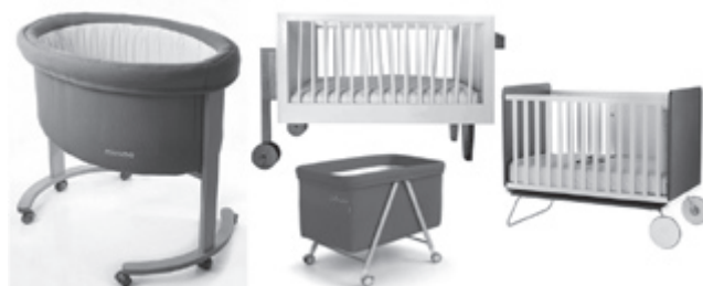
Рис. 3. Модели современных люлек-кроваток с функцией перемещения