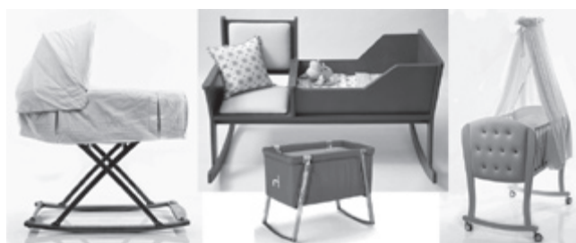
Рис. 2. Модели современных напольных люлек с функцией качания