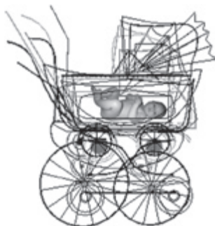
Рис. 4. Эволюция формы коляски