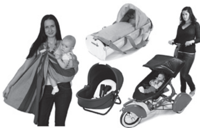
Рис. 5. Варианты транспортировки ребенка

Форма и материал для изготовления средств транспортировки ребенка первого года жизни сильно изменились с древнего времени до наших дней. Но основными параметрами для проектирования, как и несколько веков назад, являются размеры ребенка, его рост, вес. Основой современного художественного проектирования, в том числе формообразования элементов БПС ребенка до года, является многофункциональность. Эта тенденция берет свое начало в народной культуре.